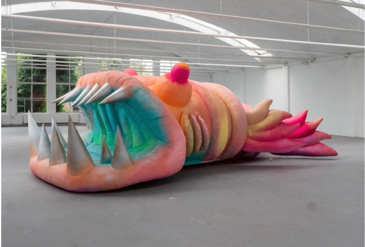
Een eerste ontwerp van het kinderkunstwerk voor in het Odapark