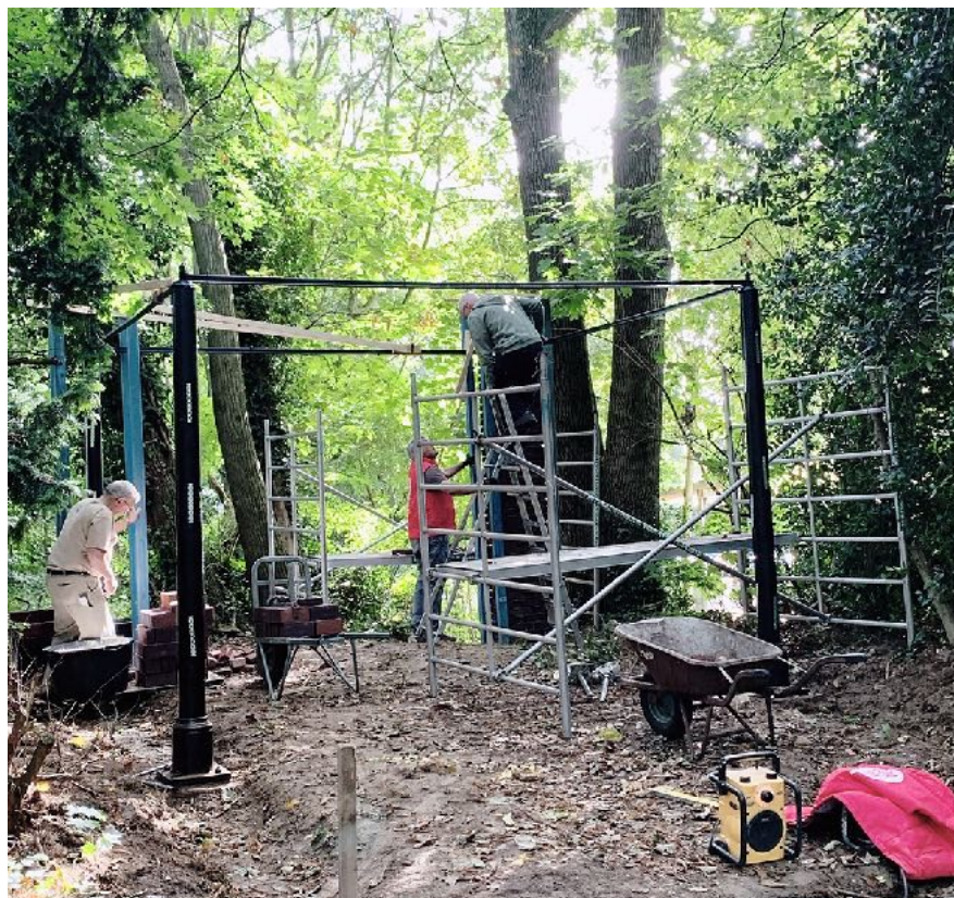
Vrijwilligers Mies, Adnan en Peter werken aan hun 'corona-project'. In het najaar van 2021 restaureerden ze een historisch prieeltje in het park dat sinds de jaren '60 was vervallen tot een door klimop overwoekerde ruïne.

Door corona was het de eerste helft van het jaar onmogelijk om fysieke bijeenkomsten te plannen. Veel activiteiten lagen stil; zo kwam de klusgroep enkele maanden niet bij elkaar. Via postkaarten en de Oda-inside werd gepoogd toch contact te houden, bij sommige werkzaamheden mochten vrijwilligers wel alleen of in tweetallen meehelpen. In september konden we voor het eerst in twee jaar weer een vrijwilligersbijeenkomst plannen, een gezellige bijeenkomst in het Theehuis.