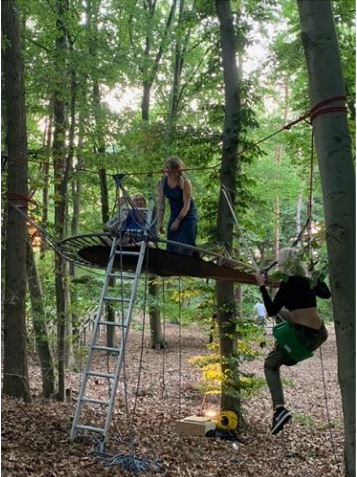
Studenten van de Kunstacademie Maastricht takelden een tijdelijk kunstwerk tussen de bomen