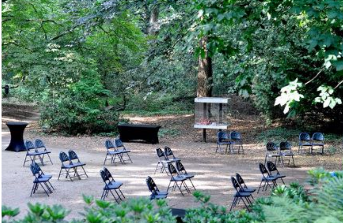
Voorafgaand aan de opening van "Je Loopt Door Mijn Hoofd" staan de stoelen klaar, uiteraard op 1,5 meter afstand.