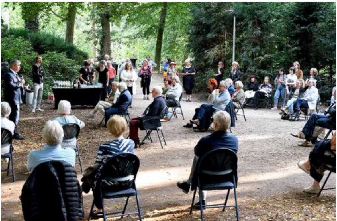
Ondanks de coronamaatregelen toch een drukke en mooie opening van "Je Loopt Door Mijn Hoofd"