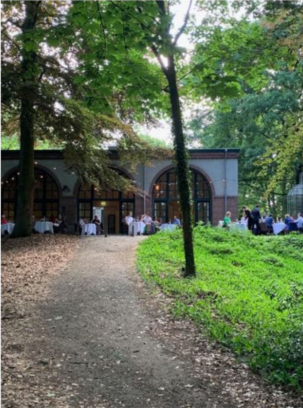
Zomers genieten in het Odapark, in samenwerking met De Beejekurf