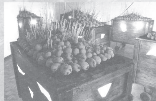
gebruikte foto's in deze uitnodiging zijn van eerdere installaties van Sylvia Dekker